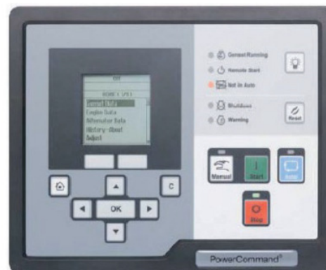
Display/pannello di controllo PowerCommand 2.2

Nota: Per ulteriori informazioni sul sistema di controllo, fare riferimento alla documentazione del prodotto PC2.2 display/ pannello di controllo PowerCommand 2.2.